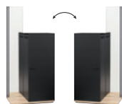
Valet 1 porte 1 miroir 2 tablettes 1 patène à 3 têtes Réversibilité gauche/droite

L 34 x H 72 x P 44 W 13" x H 28" x D 17"