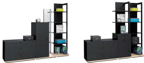
Côté rangement / Storage side

Juxtaposez les meubles et composez selon votre inspiration. Put the furniture together and design your room to your tastes.