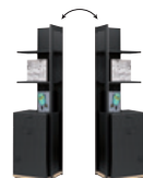
Rangement 2 tiroirs 1 porte 2 étagères Réversibilité gauche/droite

L 51 x H 200 x P 50 W 20" x H 79" x D 20"