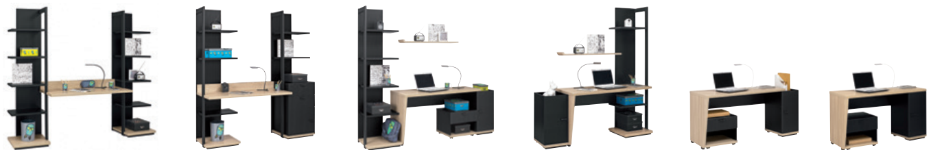
Côté bureau / Desk side