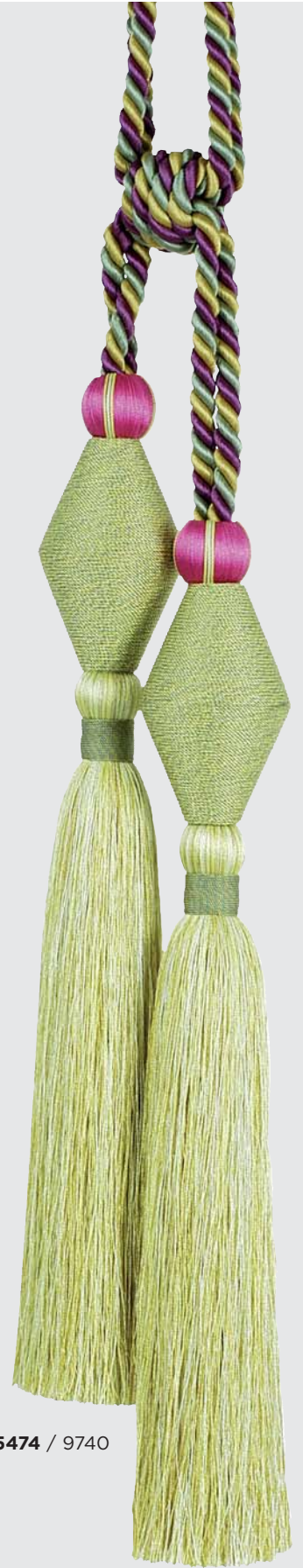
35474 / 9740