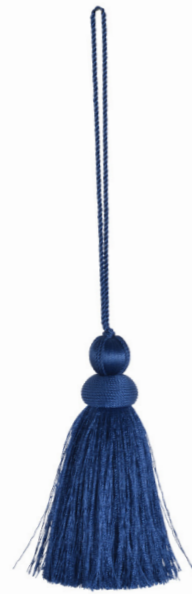
Gland de clé Key tassel 35047 + col