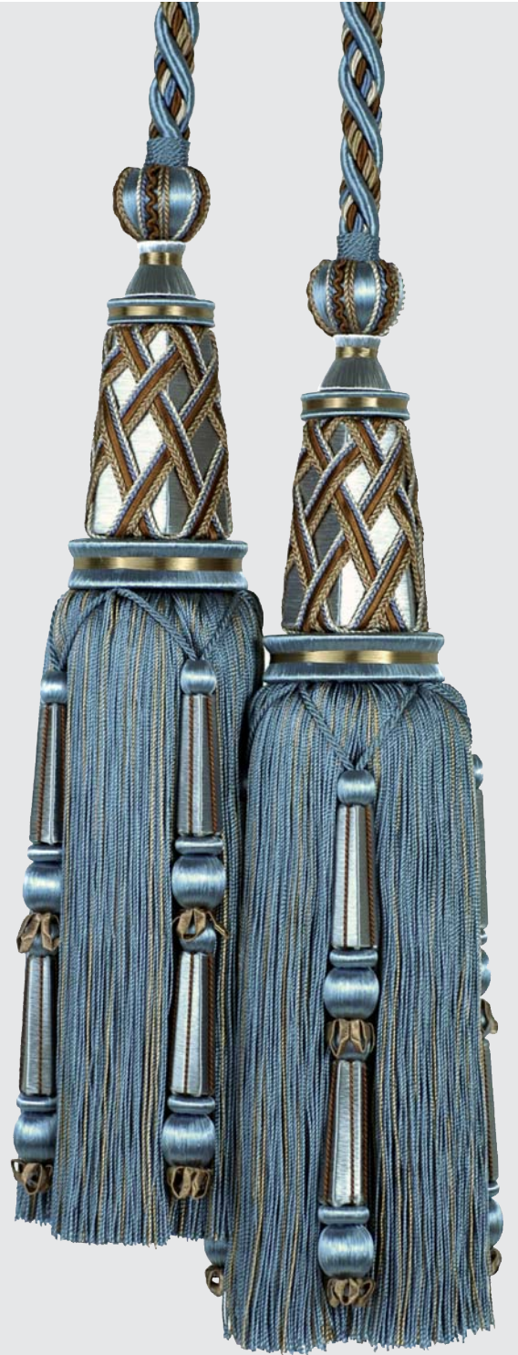
35434 / 9680