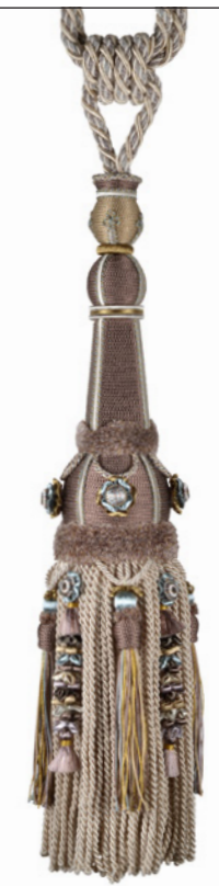
Brun vison 9800