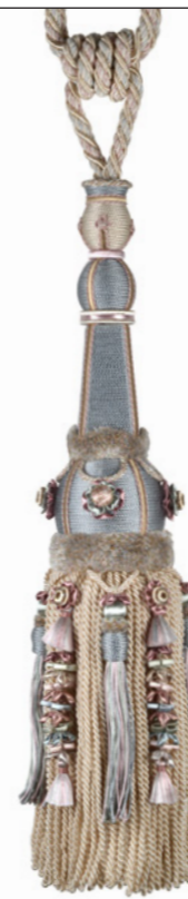
Bleu glacier 9600