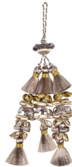
Gland de clé Key tassel 35080 + col H 11,5 cm - 4 17/32"