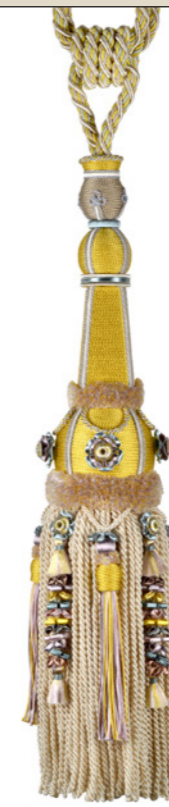
Jaune céleste 9100