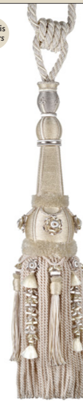
Blanc hermine 9010