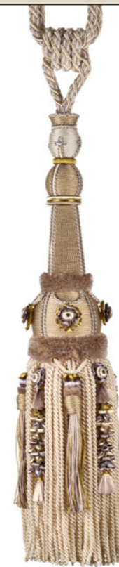
Grège Bertin 9020