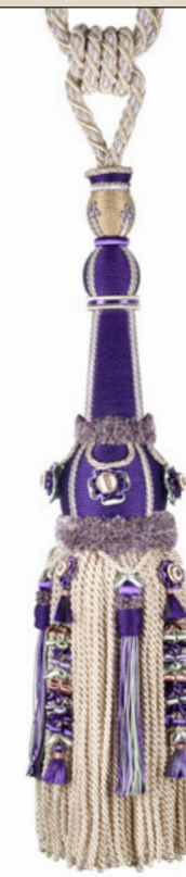
Violet amarante 9450