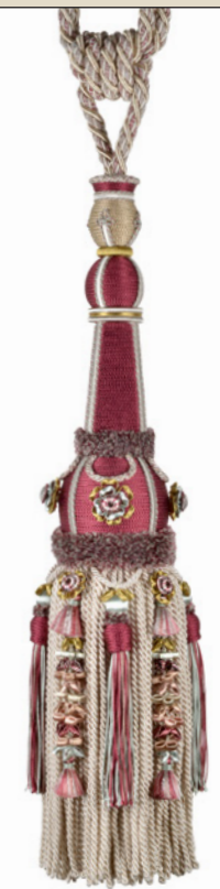
Rouge cardinalis 9500