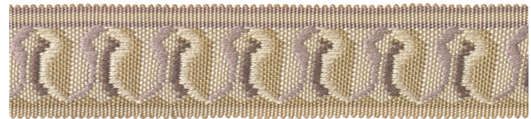
Galon jacquard - Jacquard braid - 32270 + col