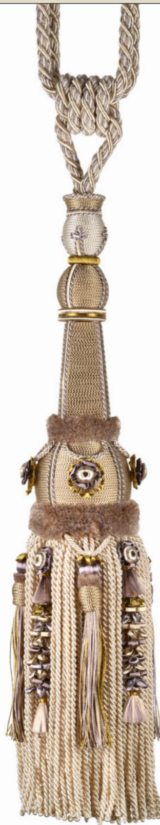
Embrasse 1 gland Tassel tieback 35055 + col H 43,5 cm - 17 1/8" L 100 cm - 39 3/8"