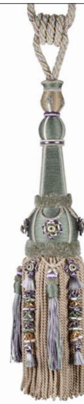
Vert céladon 9700