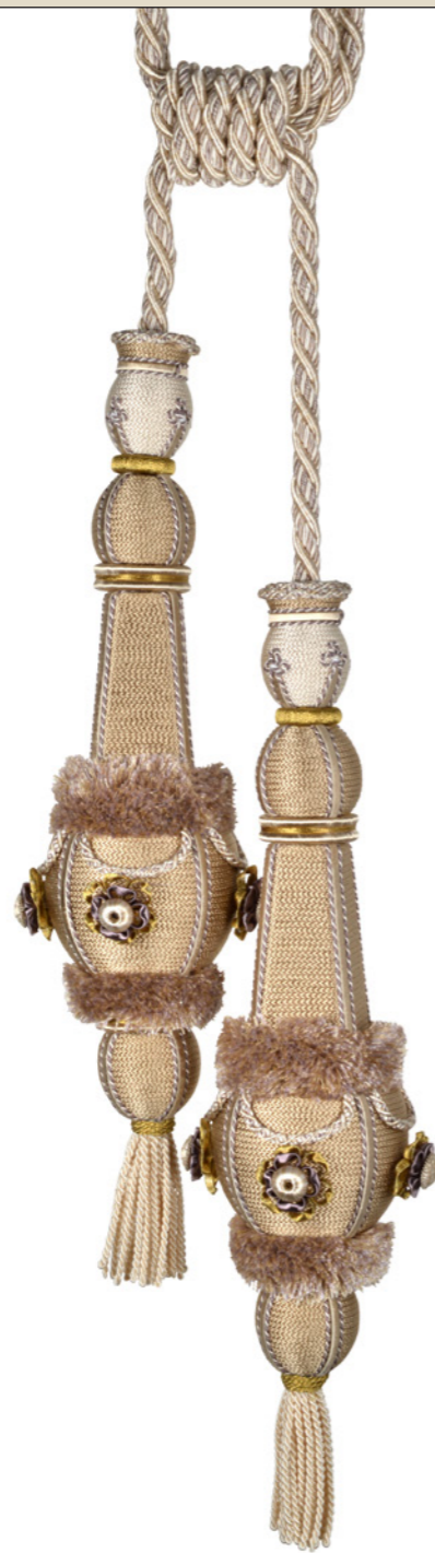
Embrasse 2 glands Double tassel tieback 35061 + col H 34 cm - 13 3/8" L 100 cm - 39 3/8"