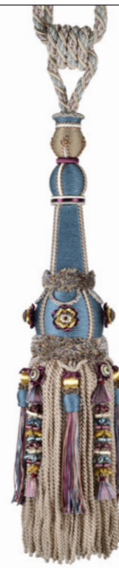
Bleu nattier 9620