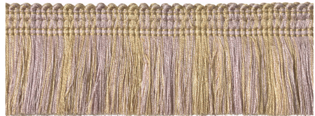
Frange mousse - Moss fringe - 33214 + col