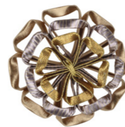
Cartisane Rosette 36006 + col Diam. 5,5 cm - 2 1/32"