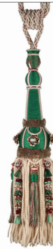
Vert malachite 9710