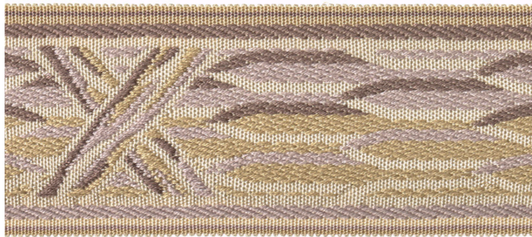
Galon jacquard - Jacquard braid - 32271 + col