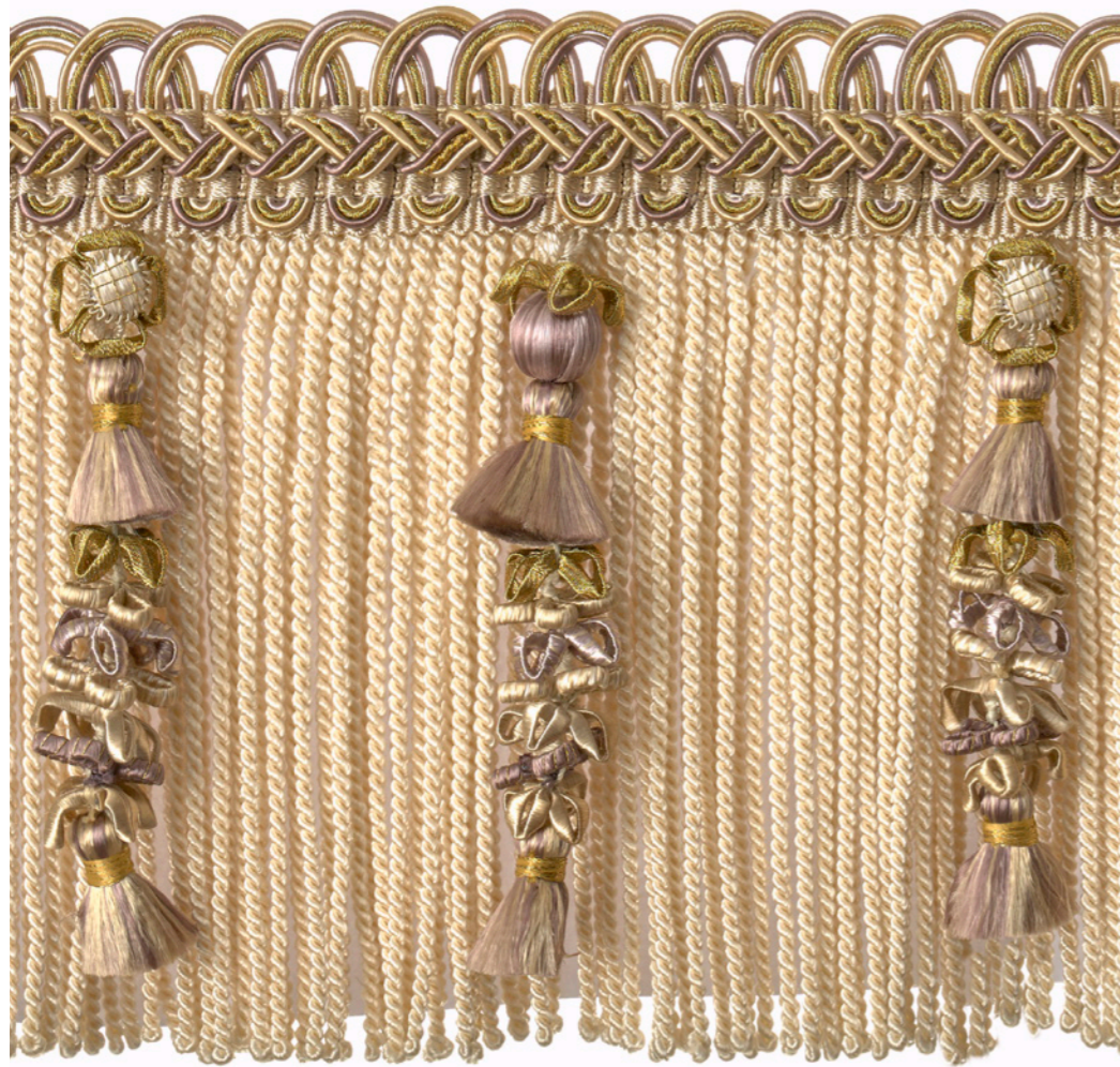
Frange moulinée enjolivée - Embellished bullion fringe - 33212 + col