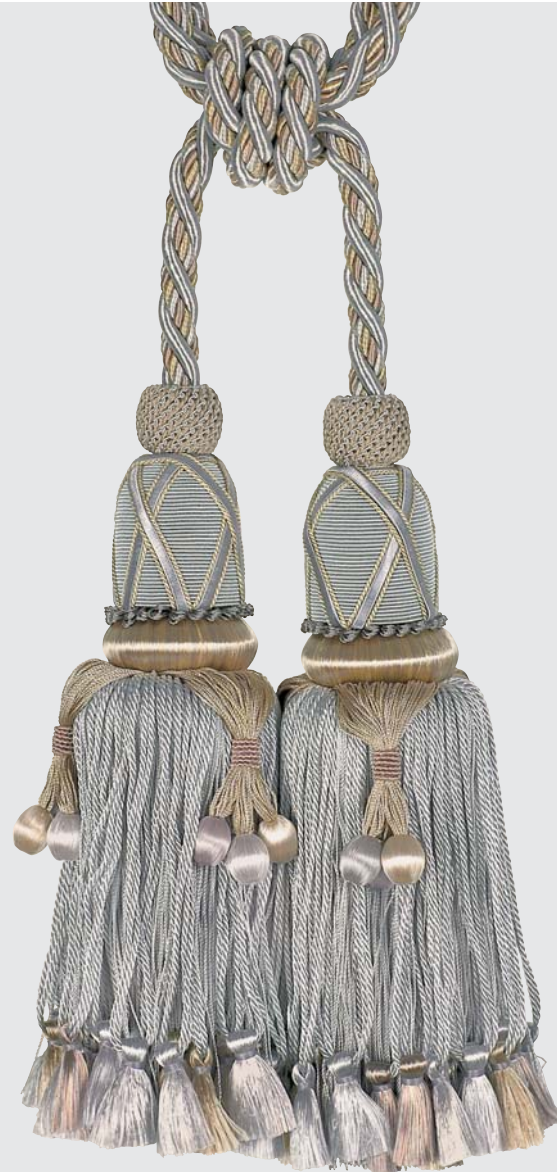
35477 / 9900